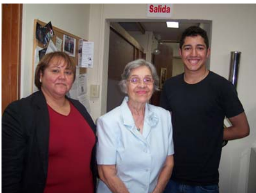
Último Día de Trabajo Felicitaciones