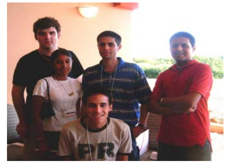
Recaudando Fondos en un Torneo de Golf