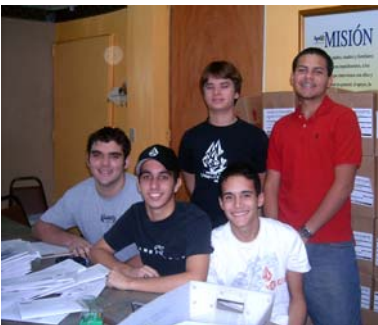
Preparando Envío Boletín 2004