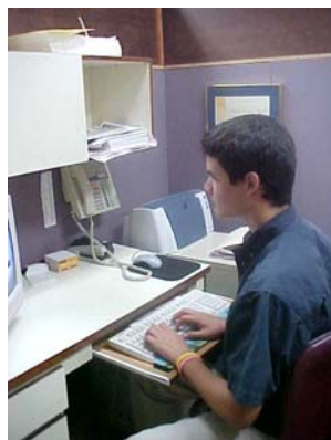
En la computadora preparando material