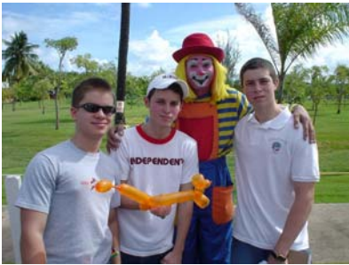
Actividad de Recaudación de Fondos