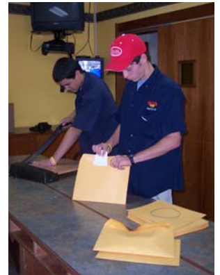
Preparando Material para Conferencia Anual 2005

Esperamos sirvan de ejemplo a otros estudiantes y a