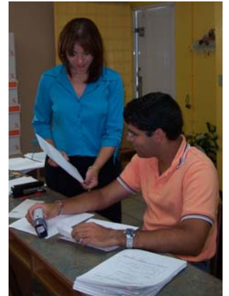
Ofreciendo Apoyo en el Área de Contabilidad